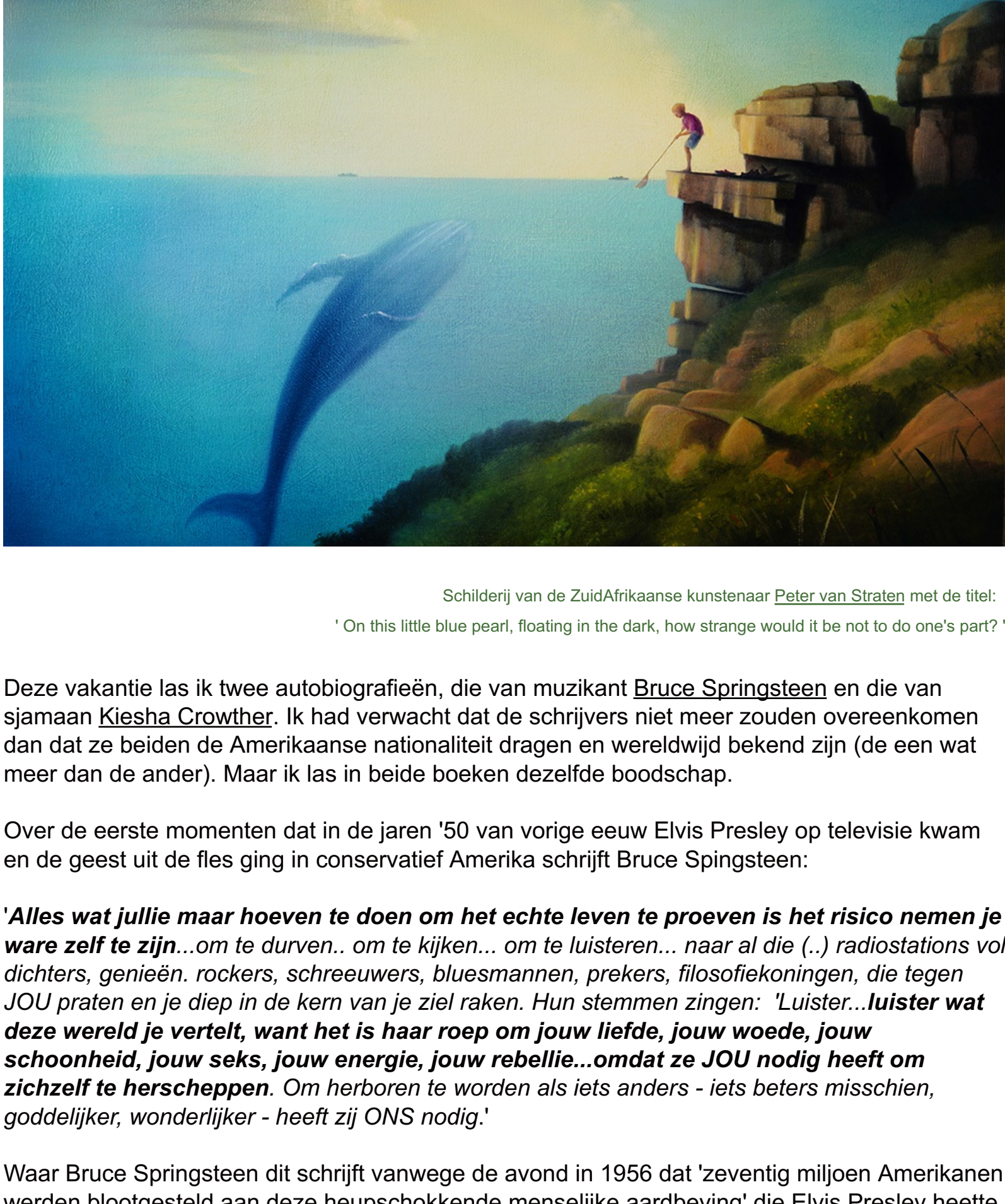
Schilderij van de Zuid-Afrikaanse kunstenaar Peter van Straten met de titel: 'On this little blue pearl, floating in the dark, how strange would it be not to do one's part?'

Deze vakantie las ik twee autobiografieën, die van muzikant Bruce Springsteen en die van sjamaan Kiesha Crowther . Ik had verwacht dat de schrijvers niet meer zouden overeenkomen dan dat ze beiden de Amerikaanse nationaliteit dragen en wereldwijd bekend zijn (de een wat meer dan de ander). Maar ik las in beide boeken dezelfde boodschap.